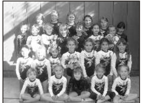
Die Jüngsten der Turnerschaft Selb, für einige war es der erste Wettkampf, freuten sich über ihre gelungenen Übungen.